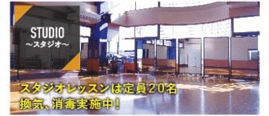
STUDIO ～スタジオ～ スタジオレッスンは定員20名 換気、消毒実施中! 広々とした2面スタジオ!