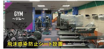
GYM ～ジム～ 飛沫感染防止シート設置 最新設備とマシン完備!