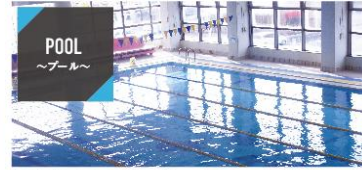
POOL ～プール～ 開放感あふれる25m×7コース!