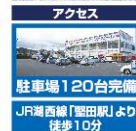
アクセス 駐車場 120台完備 JR湖西線「堅田駅」より 徒歩10分