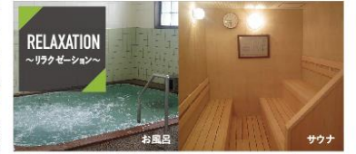
RELAXATION ～リラクゼーション～ 運動後の身体を癒すリラクゼーションスペース! お風呂 サウナ