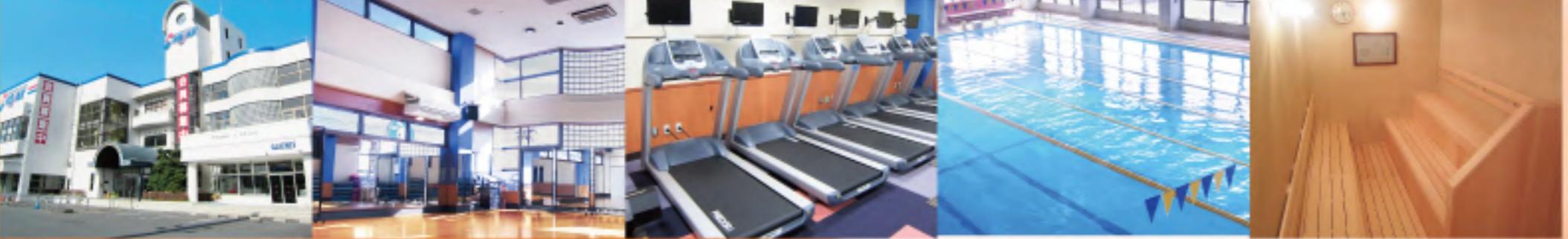
※特典の適用には3ヶ月以上継続していただける方、過去3ヶ月以上、当クラブに在籍していない方が条件となります

地域で一番オトクな スポーツクラブ コジャックの会員になると、 月会費のみで！ 全ての施設が 使い放題！ 豊富なプログラムが 受け放題！